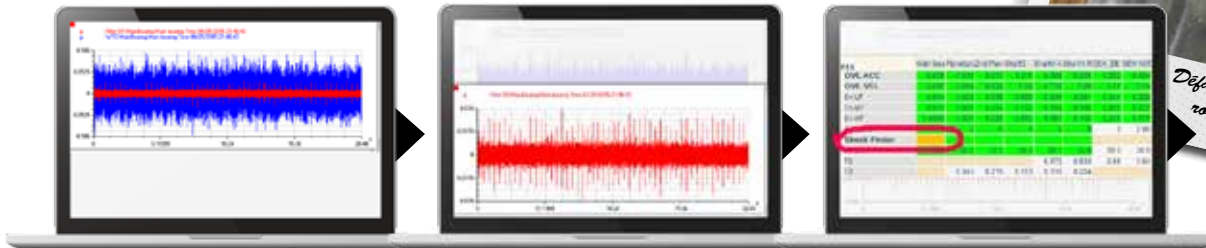
Mesure sur le roulement principal Les chocs (en rouge) sont noyés dans le signal brut (en bleu)