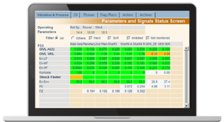
La Grille De Détection De Défaut (G4D) telle que présentée à l'expert dans le logiciel ONEPROD NEST Analyst

Les données sans intérêt pour le diagnostic, mesurées pendant des variations de régime, peuvent être automatiquement filtrées et éliminées. Toutes les informations collectées sont identifiées avec une précision extrême, permettant de ne stocker que les informations les plus pertinentes. L'état de santé des éoliennes peut être déterminé avec une très grande précision sur la base de quelques indicateurs bien ciblés.